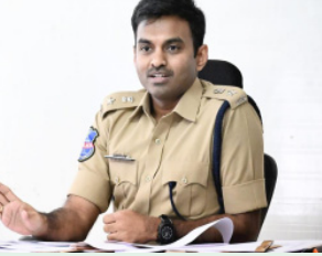
రాత్రి వేళల్లో పట్టణాలు, గ్రామాలు, హైవేలు, ఒంటరి ప్రాంతాలు మరియు సున్నత ప్రాంతాల్లో నింతరం గస్తీ నిర్వహించడం ద్వారా నేరాలను ముందూనే నివారించాలని, ప్రజల్లో భద్రతా భావన పెంపొందించే దర్యాప్తు తీసుకోవాలని ఆదేశించారు.

ఈ సమావేశంలో నేరాల గుర్తింపు మరియు డిజిటల్ నీటి కెమెరాల వినియోగంపై చర్చించారు. కీలక ప్రాంతాలు మరియు సున్నత ప్రాంతాల్లో నీటి కెమెరాల పర్యవేక్షణను సమన్వయంతోగా కొనసాగించాలని అన్నారు. జిల్లా వ్యాప్తంగా సమావేశం పెరిగింది. డి.ఎస్.పి కేసులు, డి.ఎస్.పి సాధించిన కేసుల పురోగతిని సమీక్షించారు. తీవ్రమైన సామాజిక వివాదాన్ని కేసుల్లో నాణ్యమైన దర్యాప్తు జరిపి, అనుమిత సర్క్యూల్స్ ద్వారా పట్టణాలు మరియు ద్వారా కోర్టుల్లో శిక్షలు విధించే దర్యాప్తు తీసుకోవాలని అధికారులకు ఆదేశించారు. ప్రాంతీయ మరియు కేంద్రాలకు అక్షరాస్య చేసుకుంటూ ప్రత్యేక కార్యాచరణ విధానాలను అమలు చేయాలని సూచించారు. గతంలో మరియు ఇతర పట్టణ పర్యటనలకు సంబంధించిన కేసులపై కఠిన దర్యాప్తు తీసుకోవాలని స్పష్టం చేశారు. అక్షయం అయితే, నిల్వ మరియు విధియోగం కోసం లాలనెన్సీ విధానం అమలు చేయాలని, అంతరం జిల్లా మరియు అంతరం రాష్ట్ర స్థాయి సమన్వయంతో దర్యాప్తు చేపట్టాలని తెలిపారు. ఆదివారం జిల్లా వ్యాప్తంగా నైట్