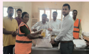
ధాన్యాలతో కూడిన రేషన్ కిట్లను బహుమతిగా అందించడం అభినందనీయమని తెలిపారు. ఈ కార్యక్రమంలో మున్సిపల్ అధికారులు, సిబ్బంది పాల్గొని రేషన్ కిట్ల పంపిణీ కార్యక్రమాన్ని విజయవంతంగా నిర్వహించారు.